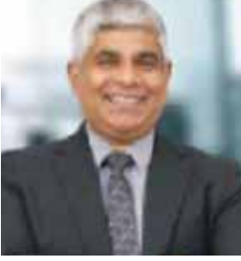
திரு. சனத் சீ த சீல்வா பிரதான நிறைவேற்று அலுவலர்

பிரதான நிறைவேற்ற அலுவலர் (பதில்) (23.12.2019 - 31.12.2019), திருமதி. கீதா விமலவீர