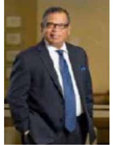
திரு. ட்ர்வின் பிரானாந்ரூயிள்ளை சபை அங்கத்தவர்